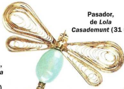
Pasador, de Lola Casademunt (31 €)