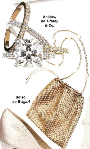
Anillos, de Tiffany & Co.