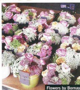
Flowers by Bornay