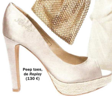
Peep toes, de Replay (130 €)