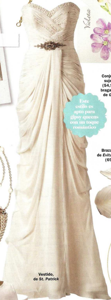
Vestido, de St. Patrick