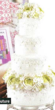
Cakes Haute Couture

15 Puedes sustituir los puros (recuerda que está prohibido fumar) por botellitas de vino o de aceite de oliva con etiquetas personalizadas . Consulta la web de Mr. Wonderful , se aleja de lo típico, y hace diseños modernos y muy diferentes que seguro querrás enmarcar. Si encargas las invitaciones, te pueden hacer todo a juego, incluidas las etiquetas para vino, galletas, tarjetas... ¡Son monísimas! ( www.mrwonderful.es ).