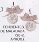
PENDIENTES DE MALABABA (28 €, APROX.).