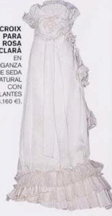
LACROIX PARA ROSA CLARA EN ORGANZA DE SEDA NATURAL CON VOLANTES (4.160 €).