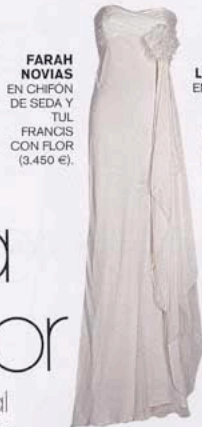
FARAH NOVIAS EN CHIFÓN DE SEDA Y TUL FRANCIS CON FLOR (3.450 €).