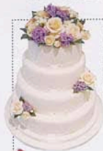
TARTA CON FLORES, DE CAKES HALITE COUTURE (VER PRECIO).