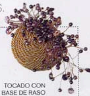
TOCADO CON BASE DE RASO Y APLIQUES DE CRISTAL, DE MONIC (340 €).