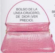
BOLSO DE LA LÍNEA CRUCERO, DE DIOR (VER PRECIO).