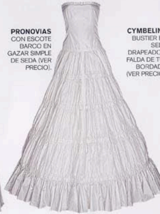
CYMBELINE BUSTIER EN SEDA DRAPEADO Y FALDA DE TUL BORDADO (VER PRECIO).