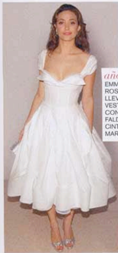
años 60 EMMY ROSSUM LLEVA VESTIDO CON AMPLIA FALDA Y CINTURA MARCADA.