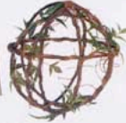
BOLA DE HIERRO, DE ANTENNAE (95 €).