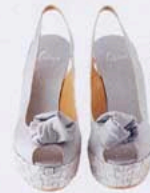
ALPARGATAS, DE SATÉN, DE CASTAÑER (170 €).

Corazones, lazos, flores, un repaso a los dorados años 50 y 60 con trazos de color rosa... y blanco.