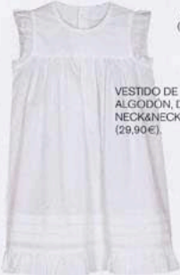
VESTIDO DE ALGODÓN, DE NECK&NECK (29,90 €).

Pasan los años, pero la esencia de antaño impregna moda y decoración, reinventando el pasado.