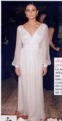
diosa griega LA ACTRIZ ARGENTINA MIA MAESTRO CON ESCOTE EN UVE Y MANGAS DE TUL.