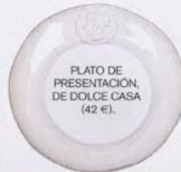
PLATO DE PRESENTACIÓN, DE DOLCE CASA (42 €).