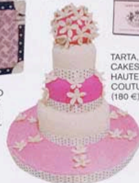
TARTA DE CAKES HAUTE COUTURE (180 €).