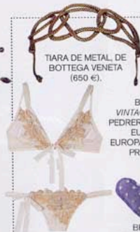
TIARA DE METAL, DE BOTTEGA VENETA (650 €).