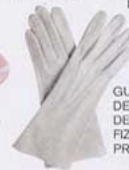
GUANTES DE PIEL, DE ION FIZ (VER PRECIO).