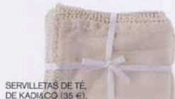
SERVILLETAS DE TÈ, DE KADI&CO (35 €).