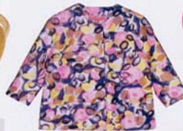
CHAQUETA ESTAMPADA, DE MANOUSH (275 €).