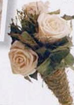
RAMO DE ROSAS, DE DOLCE CASA (46 €).