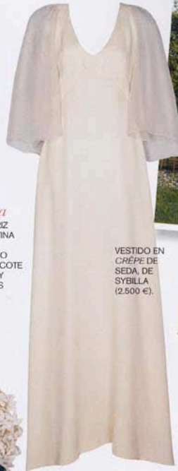
VESTIDO EN CRÉPE DE SEDA, DE SYBILLA (2.500 €).