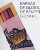
BARRAS DE GLOSS, DE BENEFIT (28,50 €).