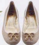
BAILARINAS, DE JUICY COUTURE (240 €).