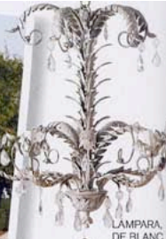
LAMPARA, DE BLANC D'IVOIRE (680 €).