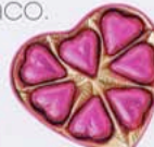
BOMBONES DE FAUCHON EN PLAISIR GOURMET (9,10 €).