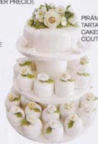
PIRÁMIDE DE TARTAS, DE CAKES HAUTE COUTURE (550 €).