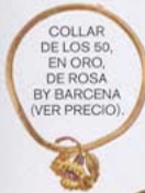
COLLAR DE LOS 50, EN ORO, DE ROSA BY BARCENA (VER PRECIO).