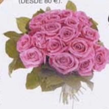
BOUQUET DE ROSAS, DE BOREALIS (DESDE 80 €).