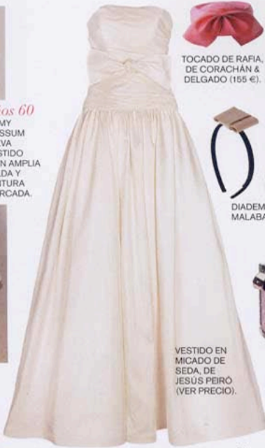
TOCADO DE RAFIA, DE CORACHAN & DELGADO (165 €).