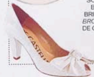
PEEPTOFN PIEL CON