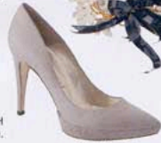
SALÓN, DE PURA LÓPEZ (VER PRECIO).