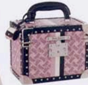
JOYERO DE LINO Y PIEL, DE JUICY COUTURE (230 €, APROX.).