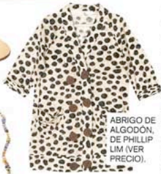
ABRIGO DE ALGODÓN, DE PHILLIP LIM (VER PRECIO).