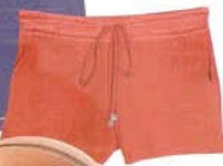
SHORTS CON CINTURILLA EN RASO, DE DINO ET LUCIA (VER PRECIO).