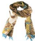
PASHMINA, DE YOKANA (70 €).