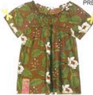
BLUSA EN BATISTA, DE KENZO (VER PRECIO).