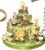
TARTA ARTESANAL, DE CAKES HAUTE COUTURE (VER PRECIO).