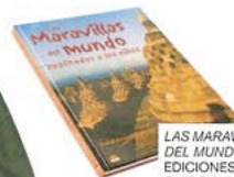
LAS MARAVILLAS DEL MUNDO, DE EDICIONES ONIRO (VER PRECIO).