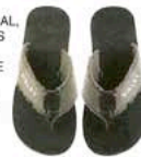
SANDALIAS, DE SISLEY (40 €).