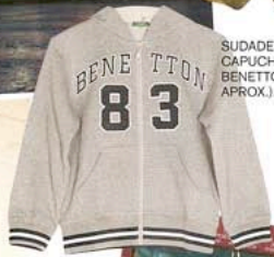
SUDADERA CON CAPUCHA, DE BENETTON (36 € APROX.).