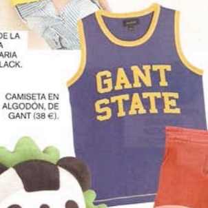
CAMISETA EN ALGODÓN, DE GANT (38 €).

Los Juegos Olímpicos de Beijing nos invitan a disfrutar de un verano muy deportivo lleno de juegos y aventuras.