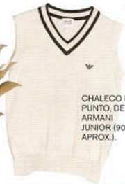
CHALECO EN PUNTO, DE ARMANI JUNIOR (90 € APROX.).