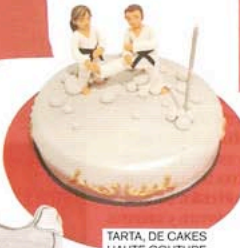
TARTA, DE CAKES HAUTE COUTURE (VER PRECIO).