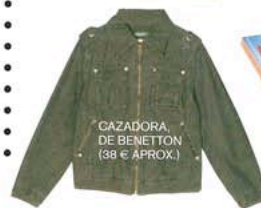
CAZADORA, DE BENETTON (38 € APROX.)