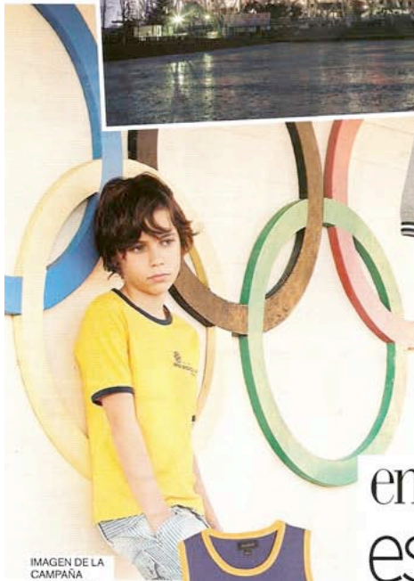
IMAGEN DE LA CAMPANA PUBLICITARIA DE JOE BLACK.