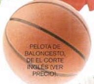
PELOTA DE BALONCESTO, DE EL CORTE INGLES (VER PRECIO).