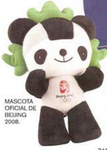
MASCOTA OFICIAL DE BEIJING 2008.