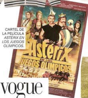
CARTEL DE LA PELÍCULA ASTERIX EN LOS JUEGOS OLÍMPICOS.