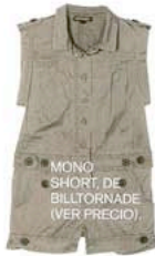
MONO SHORT, DE BILLTORNADE (VER PRECIO).