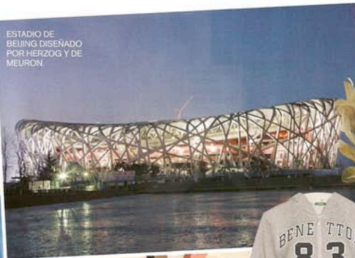
ESTADIO DE BEIJING DISEÑADO POR HERZOG Y DE MEURON.