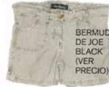
BERMUDA, DE JOE BLACK (VER PRECIO).