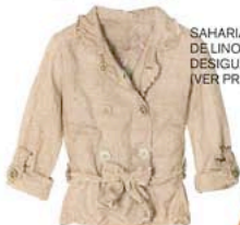
SAHARIANA DE LINO, DE DESIGUAL (VER PRECIO).